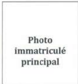
Photo immatriculé principal